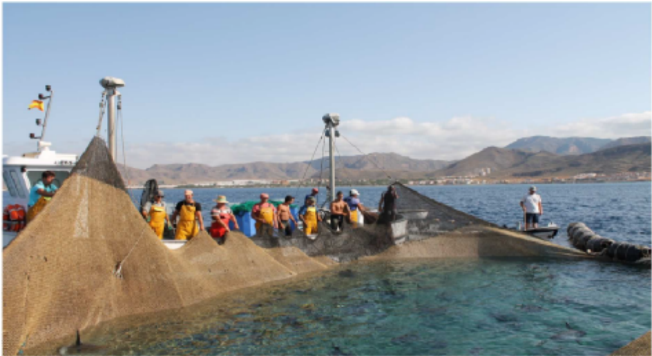
بلند کردن تله (لوا) در آلمادربا در لا آزوهایا (اسپانیا)

حفظ و صدها موقعیت شغلی به صورت مستقیم و غیرمستقیم حفظ می‌شود. انواع دیگری از تله‌های ماهی تن نیز در امتداد مدیترانه برای صید گونه‌های کوچک‌تر ماهی تن مانند ماهی تن گلوله‌ای، یا ماهی تن جهنده و همچنین ماهی‌های بوی شنی، ماهی مرکب یا عنبرماهی بزرگ یافت می‌شوند. ارزش این رویکرد به‌عنوان یک روش پایدار، آزمایش آن در منطقه لا آزوهایا (کارتاخنا) است، به‌عنوان مثال بررسی عملکرد ناوگان ماهیگیری آلمادربا مجرای واقع در جنوب اسپانیا که از سال ۱۹۴۶ میلادی به طور منظم بین فوریه و ژوئیه به کار گرفته شده است، مبین این مسئله است. اخیراً این انجمن، استراتژی‌های مدیریت ارتباطات را با استفاده از وبسایت‌های شبکه‌های اجتماعی مانند اینستاگرام و توییتر برای جلب توجه و ارتباط با افزایش علاقه بین‌المللی به ماهی تن آبی اقیانوس اطلس توسعه داده است.